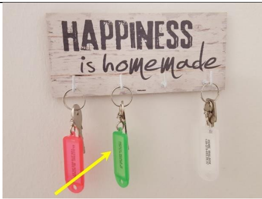
Apartment – Green key