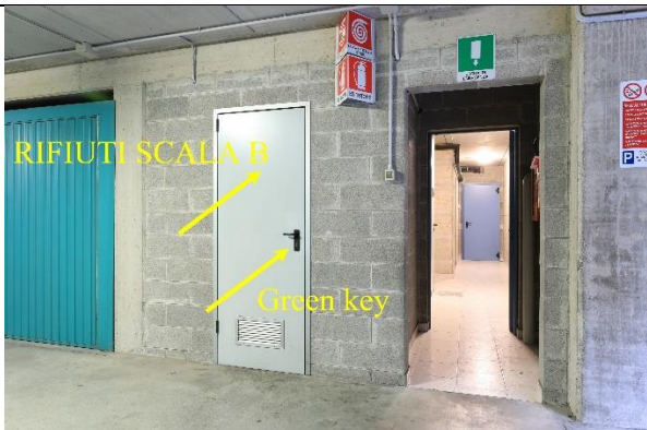
RIFIUTI SCALA B – Green Key